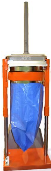
Altura de vaciado de 2.660 mm de serie

Es sencillo introducir materiales en la unidad de carga superior abierta. La compactadora es segura y fácil de manejar y la función de elevación integrada permite cambiar la bolsa de forma rápida y cómoda.