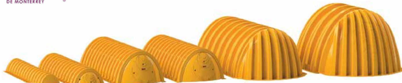
SC-160LP (85.4" x 25" x 12")