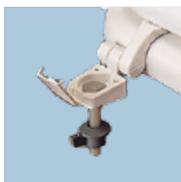
Tornillo y tuerca resistentes a la corrosión.