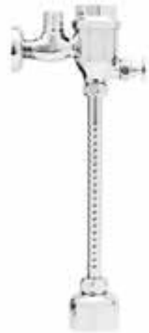
Fluxómetro de botón para mingitorio