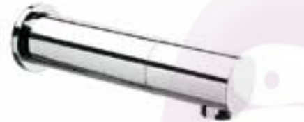
Llave tubular con sensor Lang de empotrar a pared

CÓDIGO ACABADO 25.2501.21 Cromo 25.2501.22 Acero inoxidable