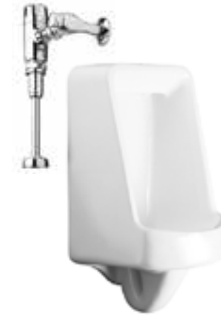
Mingitorio con fluxómetro de sensor