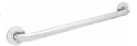
Barra 1 1/4" x 30" *Material Acero Inoxidable