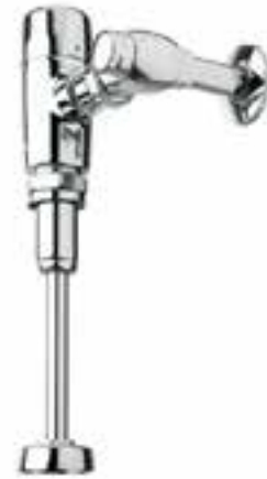
Fluxómetro expuesto con sensor para mingitorio con conexión a red eléctrica