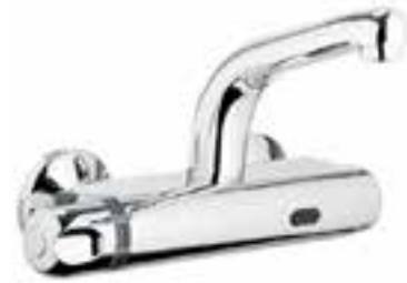
Termostato a la pared para hospitales