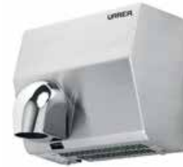
Secador de manos eléctrico dirigible en acero inoxidable Kragen