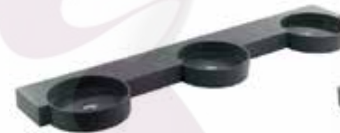
Lavabo institucional de 5 estaciones