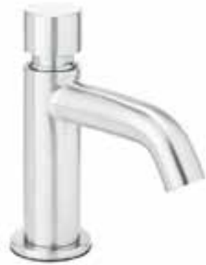
Llave temporizadora INOX®

CÓDIGO ACABADO 9243INOX Acero Inoxidable * Material acero inoxidable