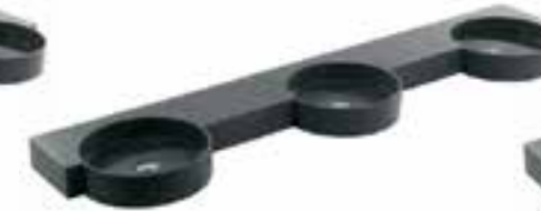
Lavabo institucional de 3 estaciones