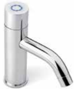
Llave con sistema touch* y luz neon para lavabo