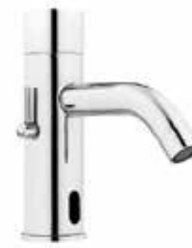
Llave mezcladora con sensor para lavabo