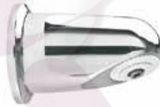
Regadera anti-vandálica Regen