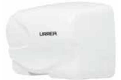
Secador de manos eléctrico en aluminio Kragen