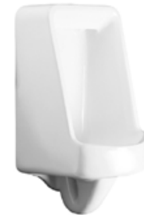
Mingitorio mediano para fluxómetro