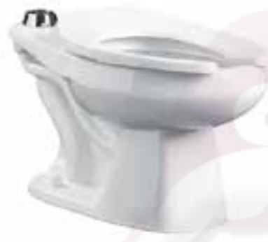
Taza alargada para fluxómetro