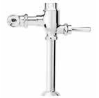
Fluxómetro recto de palanca para sanitario