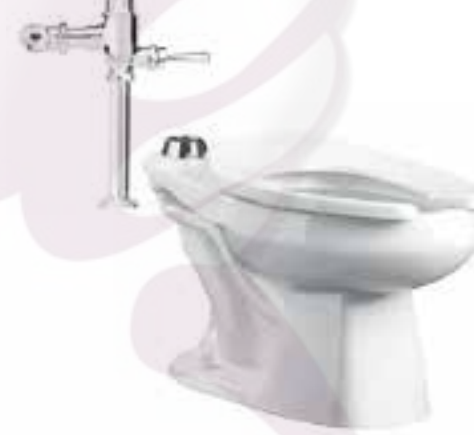
Sanitario con fluxómetro de palanca