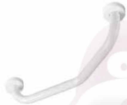
Barra de seguridad en ángulo de 45° Fort