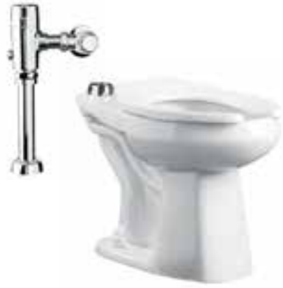
Sanitario ADA con fluxómetro de sensor