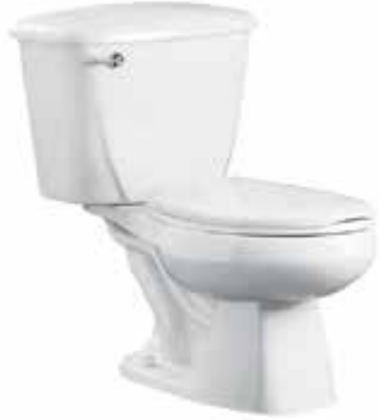
Sanitario con tanque asistido por presión