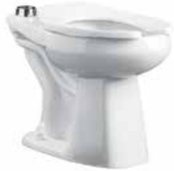
Taza alargada ADA para fluxómetro