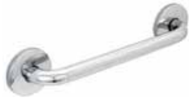
Barra 1 1/4" x 30" *Material Acero Inoxidable