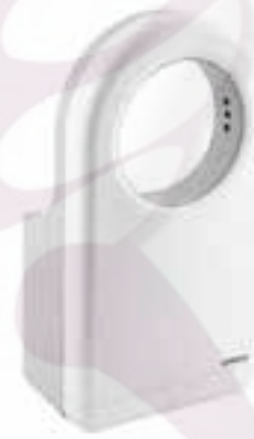
Secador de manos de alta velocidad