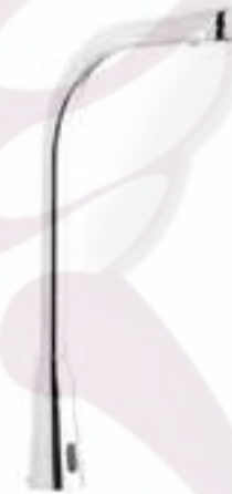
Llave de cuello alto con sensor Kragen para hospitales

CÓDIGO ACABADO 25.2501.21 Cromo 25.2501.22 Acero inoxidable