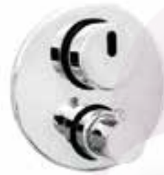
Mezcladora de sensor de empotrar para ducha con termostato Ober

CÓDIGO ACABADO 9243INOX Acero Inoxidable * Material acero inoxidable