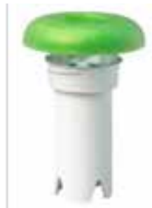
Válvula key de repuesto para mingitorio seco