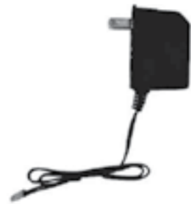
Transformador de corriente 9v hembra