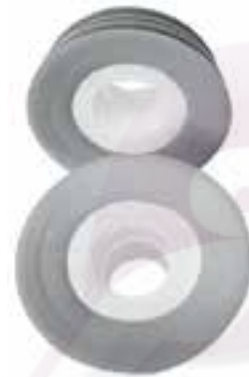
Adaptador universal para otros sistemas de mingitorio seco