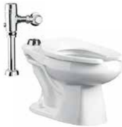
Sanitario con fluxómetro de sensor