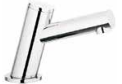
Llave para lavabo Kragen con sistema touch*