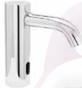
Llave con sensor Kragen para lavabo