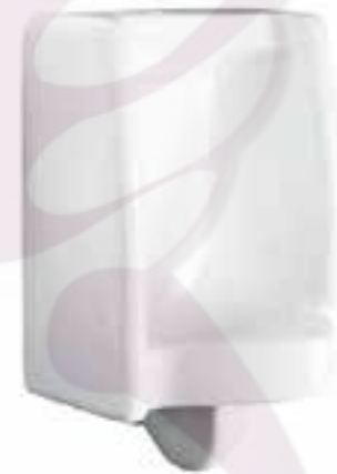
Mingitorio grande para fluxómetro