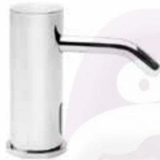
Dosificador de jabón electrónico para lavabo