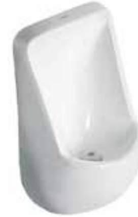
Mingitorio seco cerámico