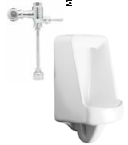
Mingitorio con fluxómetro de palanca