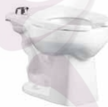
Taza redonda para fluxómetro