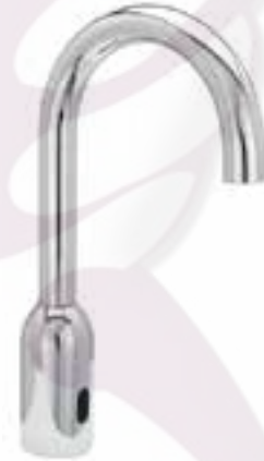
Llave con sensor Lang para lavabo