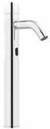
Llave alta con sensor Kragen para lavabo