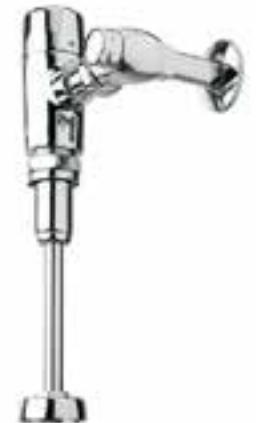
Flujómetro expuesto con sensor y opción mecánica para mingitorio de batería Klug