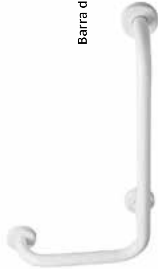
Barra de seguridad en ángulo de 90° Fort