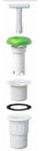
Kit adaptador universal para mingitorio seco