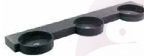
Lavabo institucional de 10 estaciones