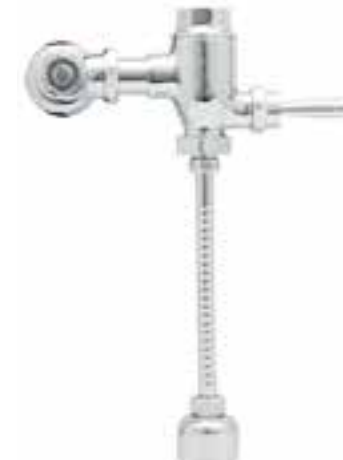
Fluxómetro de palanca para mingitorio