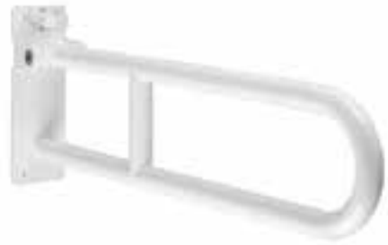
Barra de seguridad deslizable para sanitario Fort