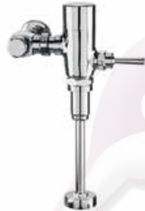
Fluxómetro expuesto de palanca para mingitorio Klug