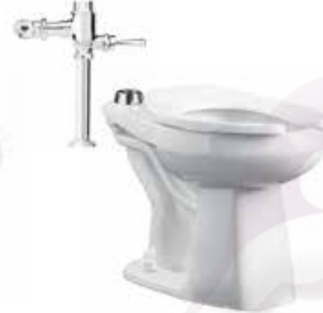
Sanitario ADA con fluxómetro de palanca