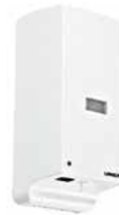
Dosificador de jabón electrónico para lavabo Kragen