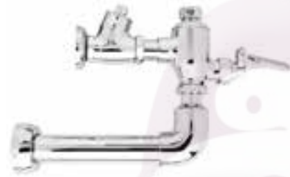
Fluxómetro de pedal para sanitario