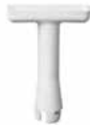
Llave de servicio para válvula key