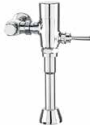
Fluxómetro expuesto de palanca para sanitario Klug