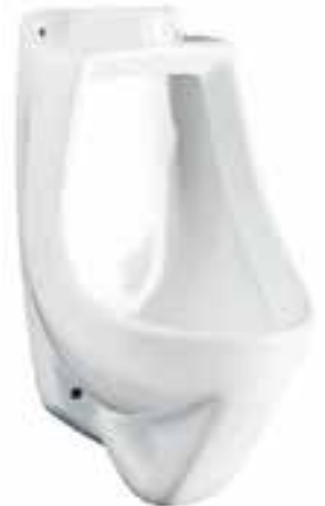
Mingitorio chico para fluxómetro