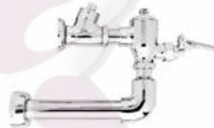
Fluxómetro de pedal para mingitorio