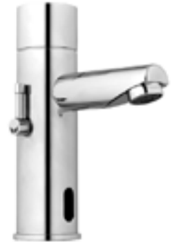
Llave mezcladora con sensor Kragen para lavabo