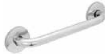
Barra 1" x 12" *Material Acero Inoxidable