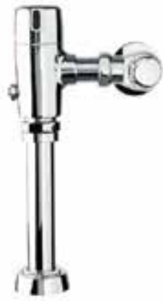
Fluxómetro expuesto con sensor para sanitario con conexión a red eléctrica