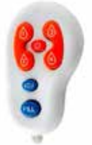
Control remoto universal para dosificador de jabón