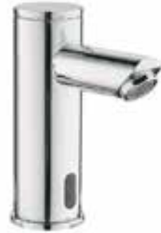
Llave con sensor Kragen para lavabo