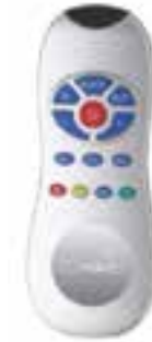
Control remoto universal para llaves de sensor