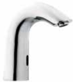
Llave con sensor Rund para lavabo