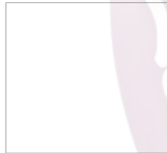
Medidas Referenciales / Estimated Dimensions Aco:mmm.(pulg) / Dim:mm.(in)