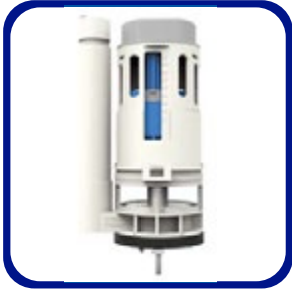
Válvula de descarga