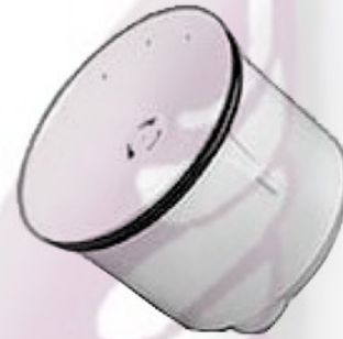
Cartridge only shown in picture.

The Cartridge is engineered to last for at least 7000 uses and to receive waste through drain holes. Waste passes through an emissible layer of Sealant, continues through a Siphon Trap System, and flows out through a Patented Baffle to prevent the loss of Sealant. A Discharge Tube in the housing directs the flow of waste into the building drain system. The Cartridge is designed as a replaceable component when its function has been exhausted.